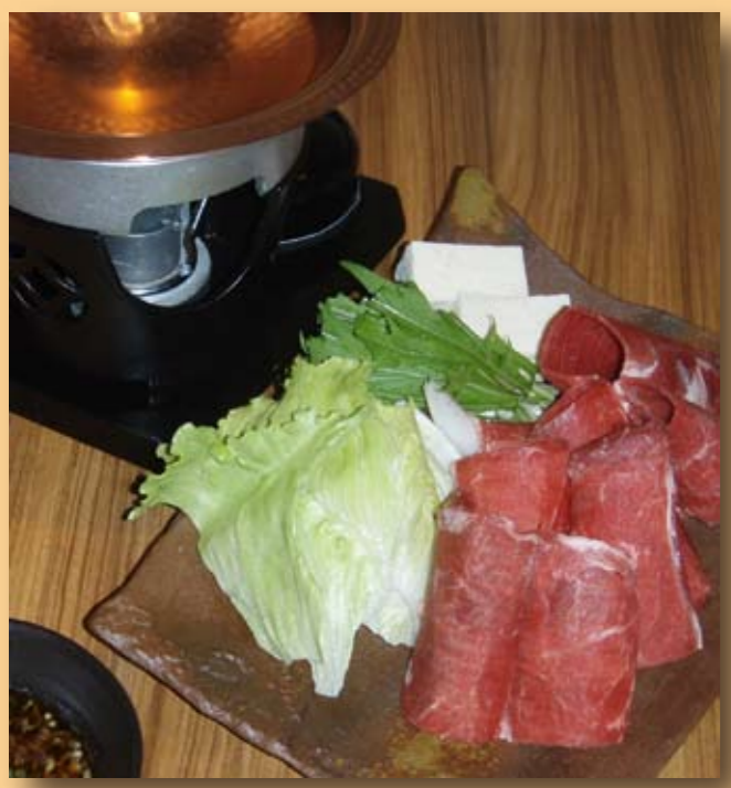
しゃぶしゃぶ (しゃぶしゃぶ酒屋 しの平)

コース料理のメインから、焼き肉・しゃぶしゃぶ、カレーやハンバーガー、栄養重視の学校給食まで、どんなシーンにもエゾシカ肉はベストフィット。