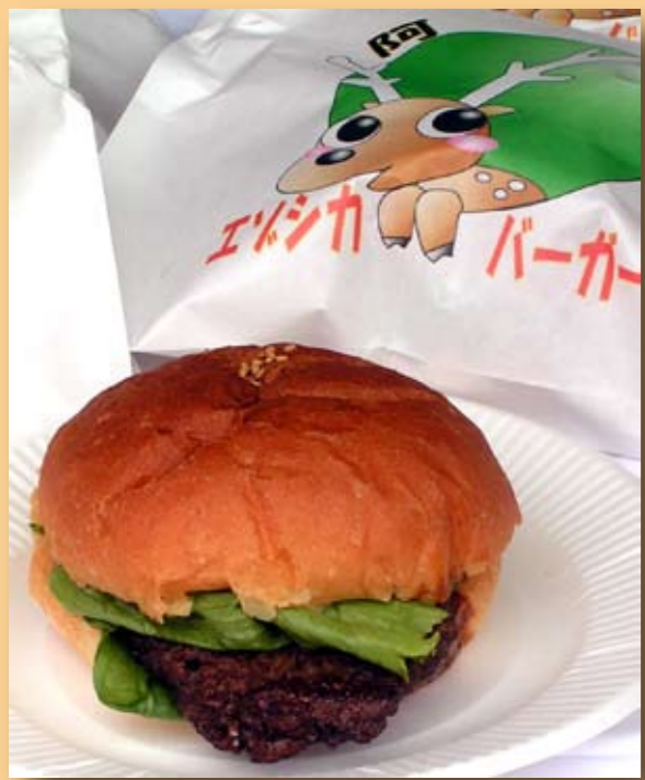
阿寒エゾシカバーガー (赤いペレー)