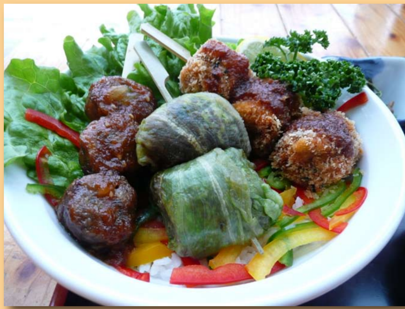
阿寒やきとり丼 (レストランきせん)