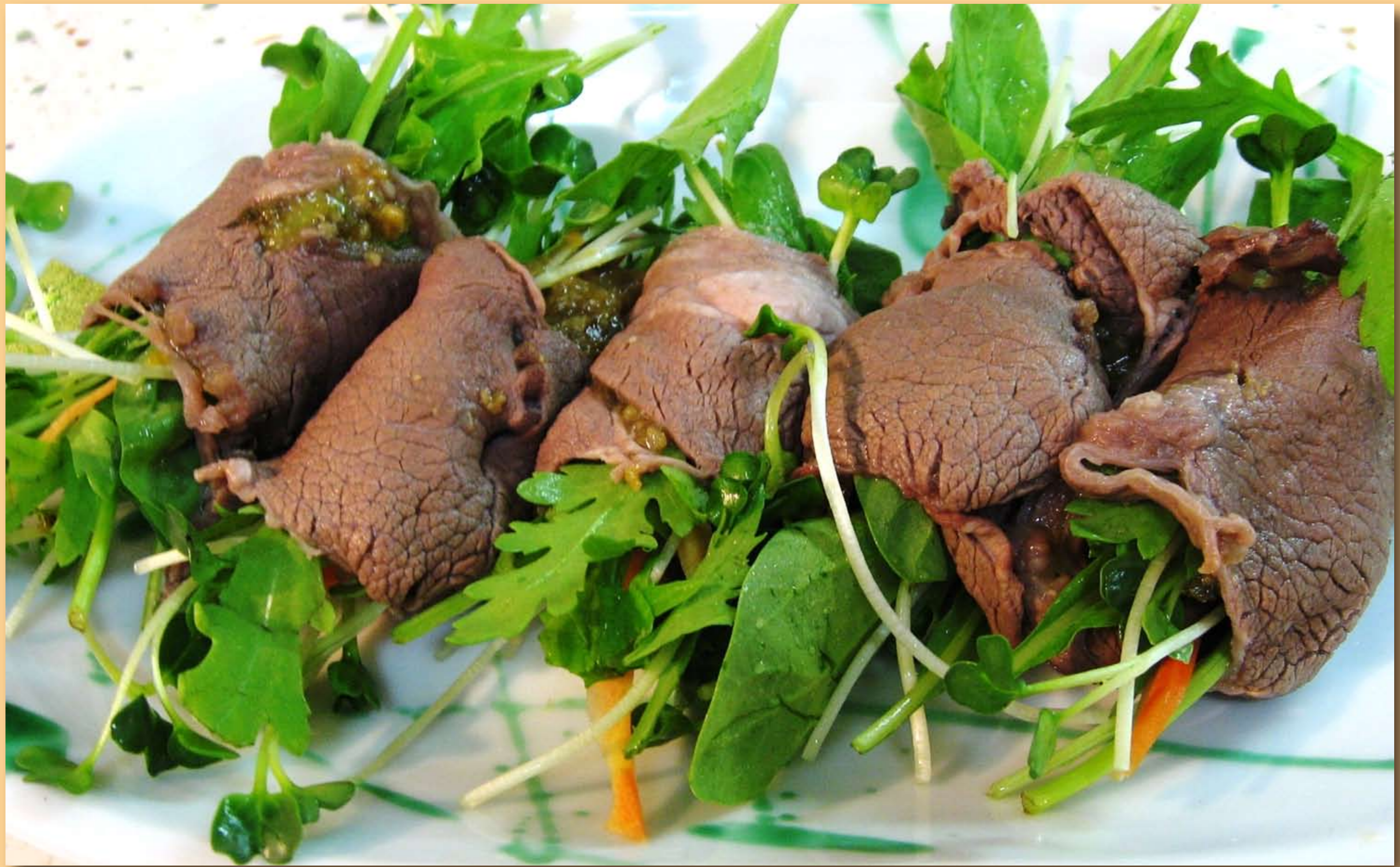
しゃぶしゃぶ クッキングサロンリエ