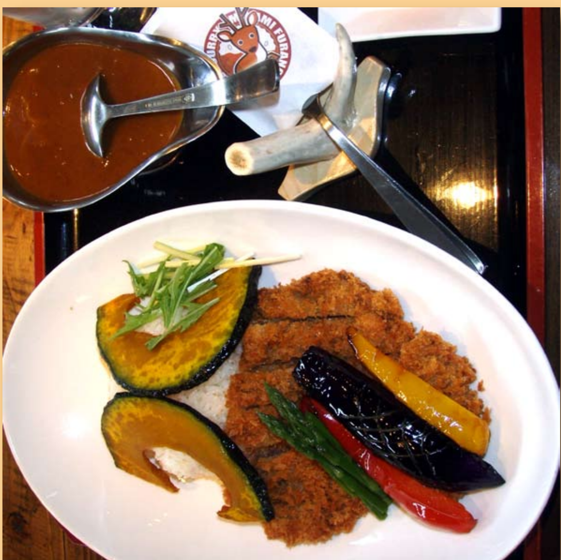
南富良野エゾシカカレー (旅籠やれすくらんなんざい)