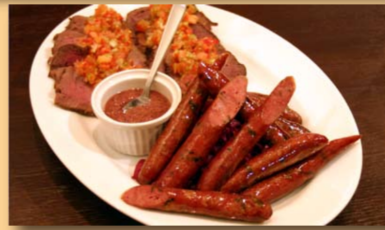
蝦夷鹿ソーセージ (ハルコサッポロ)