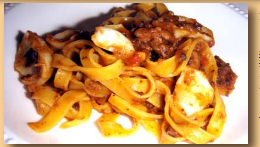
ミートソーススパゲティ (イタリア料理イルビーン)