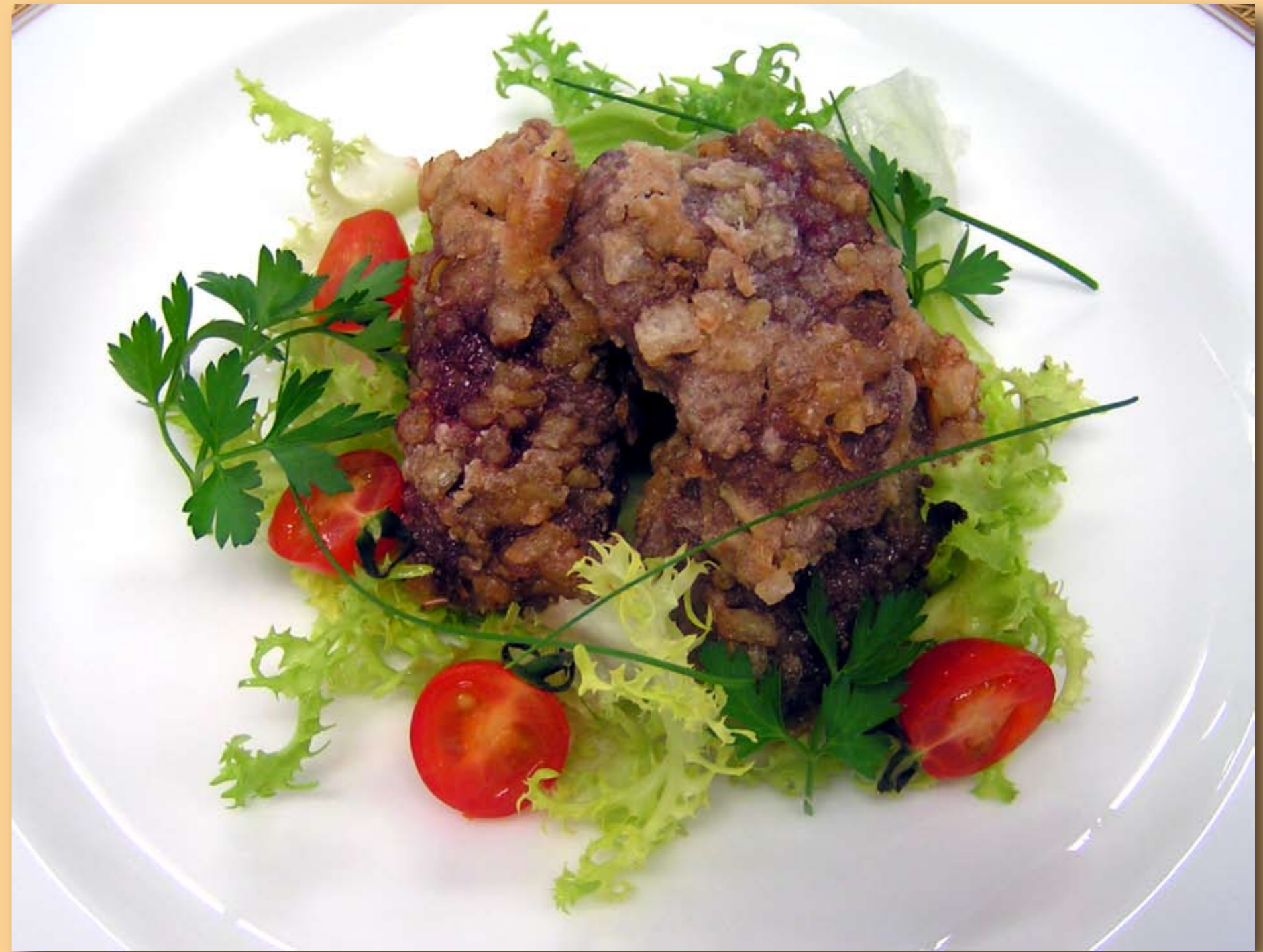
竜田揚げ (上條 シェフ)