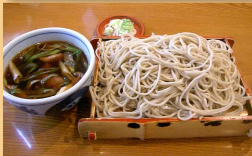
もみじせいろ (そば徳 本店)