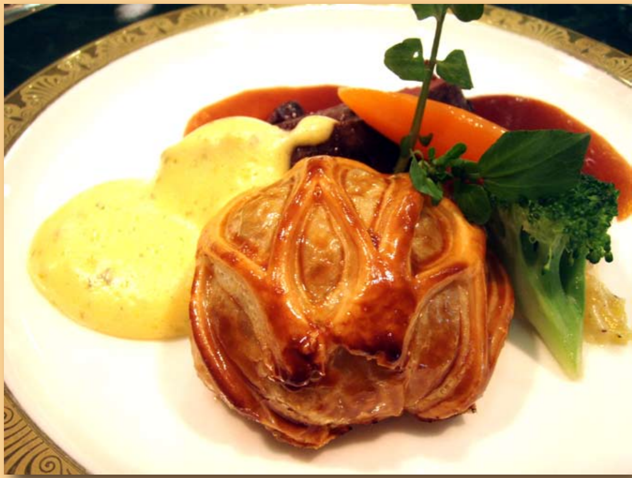
パイ包み焼き (KKRホテル レストランマイヨール)